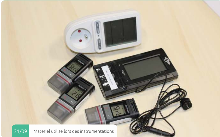
31/09 Matériel utilisé lors des instrumentations