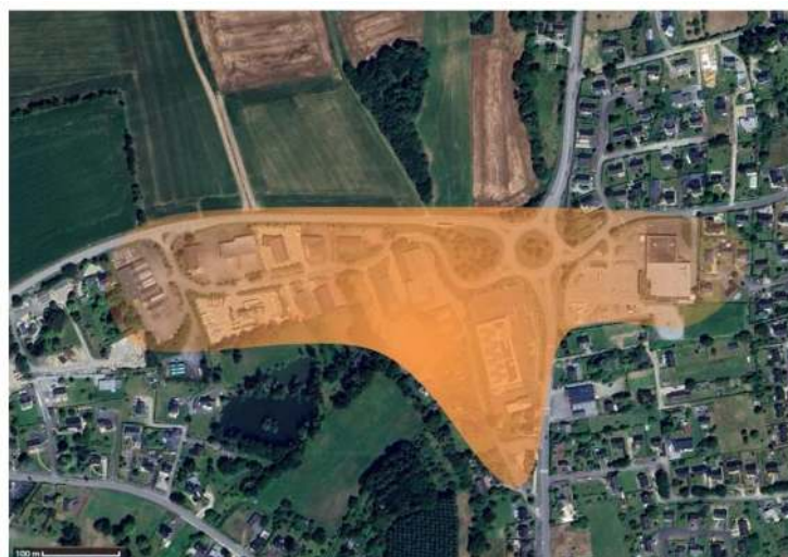
Exemple : Guer – La Dabonnière (SIP connecté).