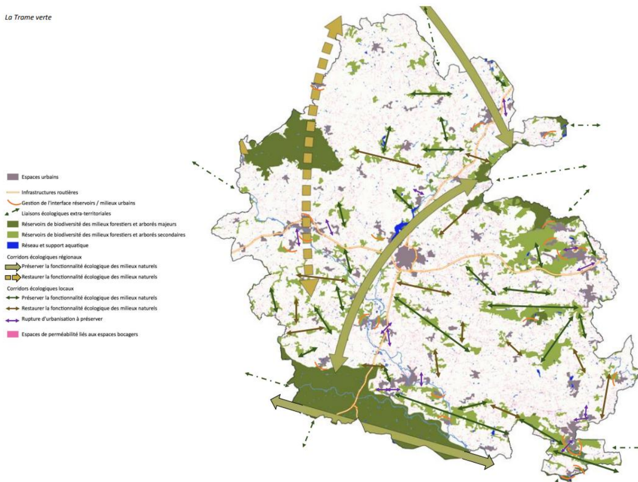
La Trame verte